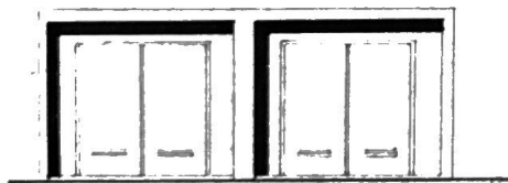
POHLED ČELNÝ 1:100