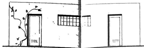
POHLED BOČNÍ 1:100